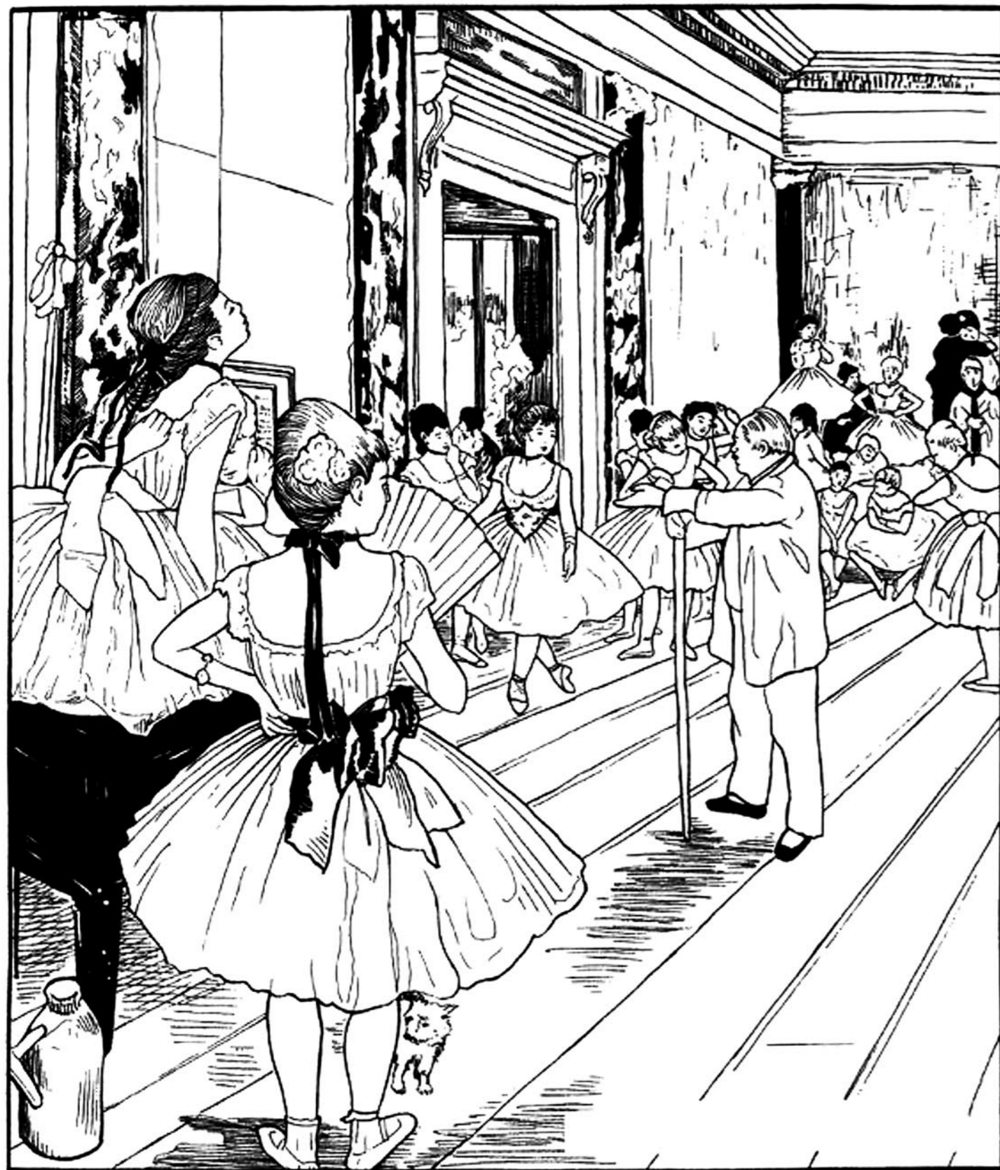
De Balletklas (La classe de danse)